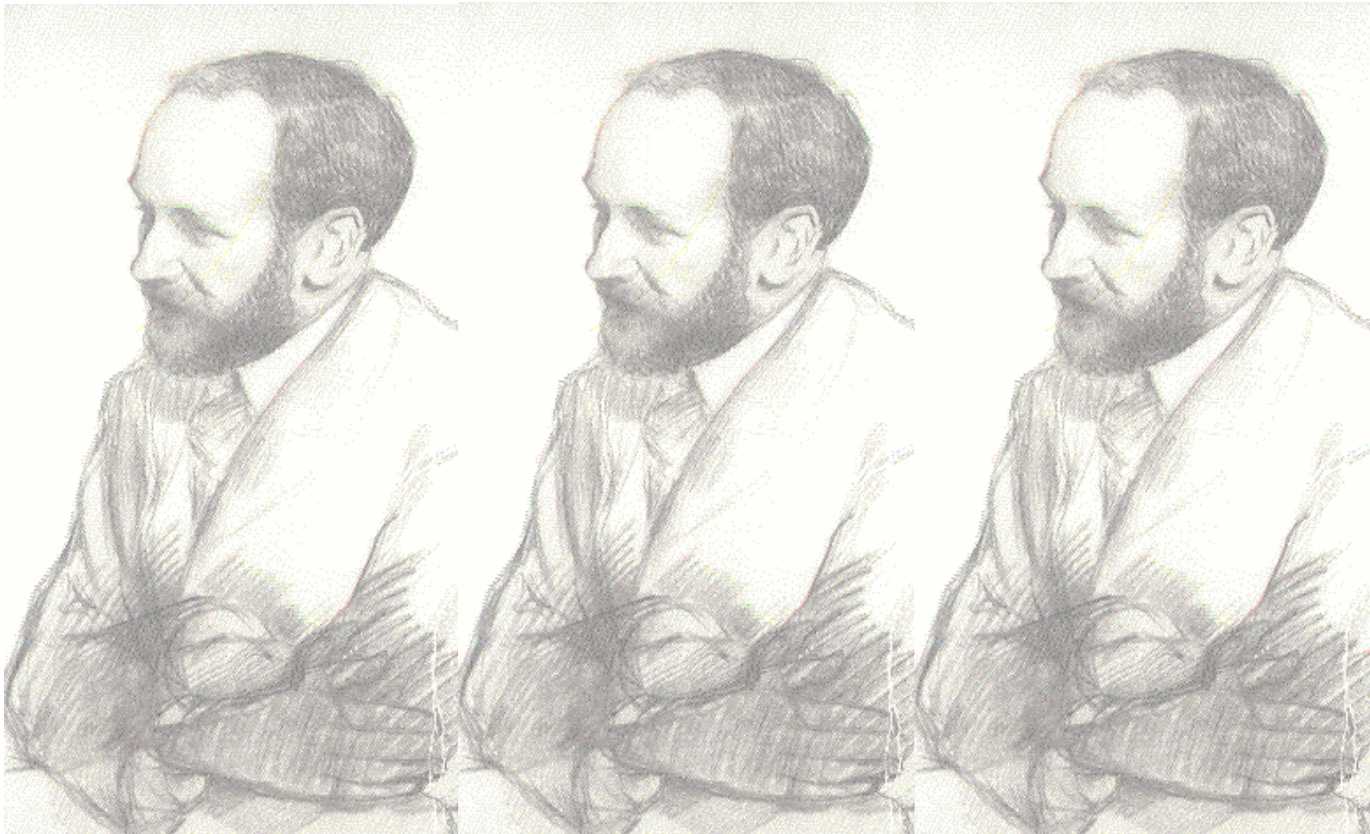
Portrait de Henri Ghéon par Théo van Ryselberghe, dessin – Musée des beaux Art, Gand