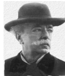
Edmondo De AMICIS (1846-1908)