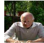
Beppe FENOGLIO (1922-1963)