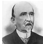
Carlo LORENZINI alias COLLODI (1826-1890)