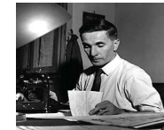
Dino BUZZATI (1906-1972)