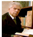
Eugenio MONTALE (1896-1981)